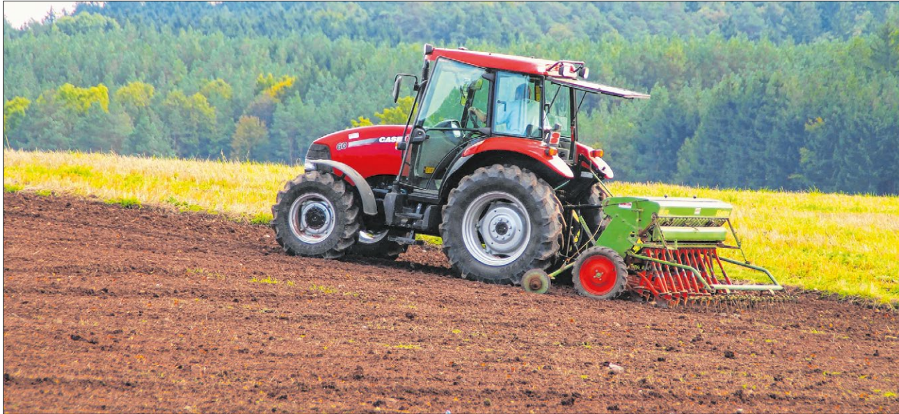
▲ Jesu' Gleichnisse verwenden Bilder aus dem Ackerbau. Davon fühlt sich mancher Landwirt auch heute angesprochen.