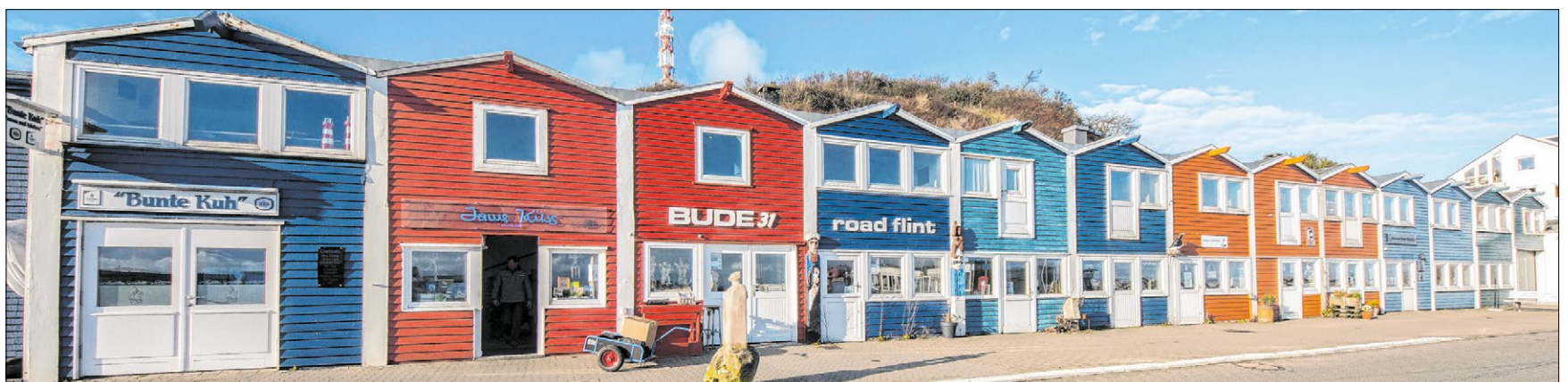
▲ Die sogenannten Hummerbuden auf Helgoland sind ehemalige Schuppen und Werkstätten der Fischer. Heute dienen sie als Kneipen, Galerien, Cafés oder Souvenirläden.