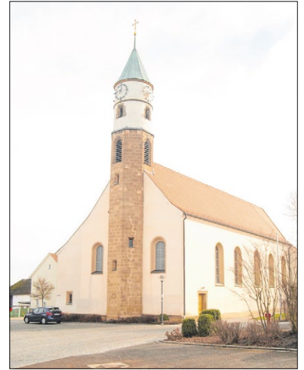
▲ Die 1765 errichtete Kirche Heilige Dreifaltigkeit in Freihung wurde 1922 nach Westen erweitert.

Freihung gehört zum Kreis Amberg-Sulzbach. Es liegt inmitten einer malerischen, leicht hügeligen Waldlandschaft mit vielen Weihern. Freihung entstand im Jahre 1542 als Bergbauort. Die katholische Pfarrkirche ist der Heiligen Dreifaltigkeit geweiht. Das Gotteshaus entstand zwischen 1764 und 1765. Errichtet wurde es unter dem Sulzbacher Maurermeister Sebastian Reger. Im Jahre 1922 erfuhr die Pfarrkirche eine Erweiterung nach Westen. 1929 erfolgte dann eine Neufassung des Innenraumes. Die Firma Böckl aus Regensburg schuf damals neue Deckenbilder und ergänzte diese durch Stuckverzierungen. Renovierungen des Gotteshauses erfolgten zwischen 1960 und 1961 sowie zwischen 1986 und 1988. Bei der Kirche handelt es sich um einen Saalbau. Der Chor ist eingezogen und an drei Seiten geschlossen. Der Turm ist aus unregelmäßigen Sandsteinquadern errichtet. Er steht an der Westseite der Kirche. Der Turm weist acht Ecken auf. Fünf davon sind in das Langhaus eingebunden. Das Obergeschoss ist zylinderförmig und wird durch ein Kegeldach bekrönt. Im Inneren der Pfarrkirche Heilige Dreifaltigkeit zieht sich eine flache Stichtappentonne über den Raum. Die Altäre und die Kanzel haben stattliche Formen. Sie entstammen der Epoche des späten Rokoko. Im Rahmen einer Dorferneuerung in den Jahren 2008 und 2009 gestaltete man in Freihung den Quellbereich neu. Die gesamte