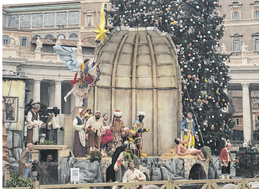
▲ Die Werke der Barmherzigkeit stehen dieses Jahr im Mittelpunkt der Weihnachtskrippe auf dem Petersplatz. Die mannshohen Figuren aus Süditalien sind vor der 30 Meter hohen Rottanne aus Polen platziert.

Es ist ein kalter aber immerhin trockener Donnerstagmittag auf dem Petersplatz: Gäste aus Polen und Neapel stehen Schlange, um Papst Franziskus zu besuchen. Sie sind aber nicht mit leeren Händen nach Rom gereist. Rund 2000 Kilometer hat das Geschenk aus Polen hinter sich: Die Rottanne ist fast 30 Meter hoch und hat einen Umfang von rund zehn Metern.