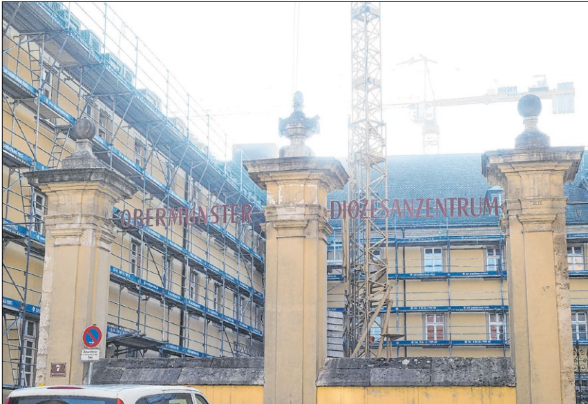
▲ Das Diözesanzentrum Obermünster wird einer Generalsanierung unterzogen. Die Baustelle wird bis November 2019 bestehen bleiben.