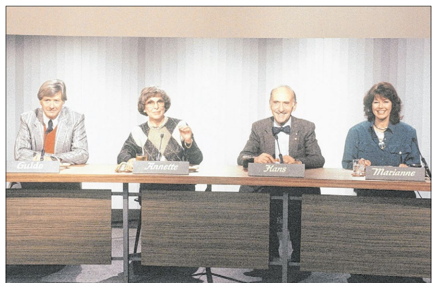
▲ Guido Baumann und seine Ratekollegen Annette von Aretin, Hans Sachs und Marianne Koch (von links) rätseln: „Was bin ich?“