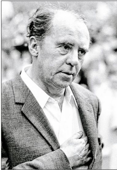
▲ Heinrich Böll.

Heinrich Böll war Mahner für Toleranz und Menschlichkeit