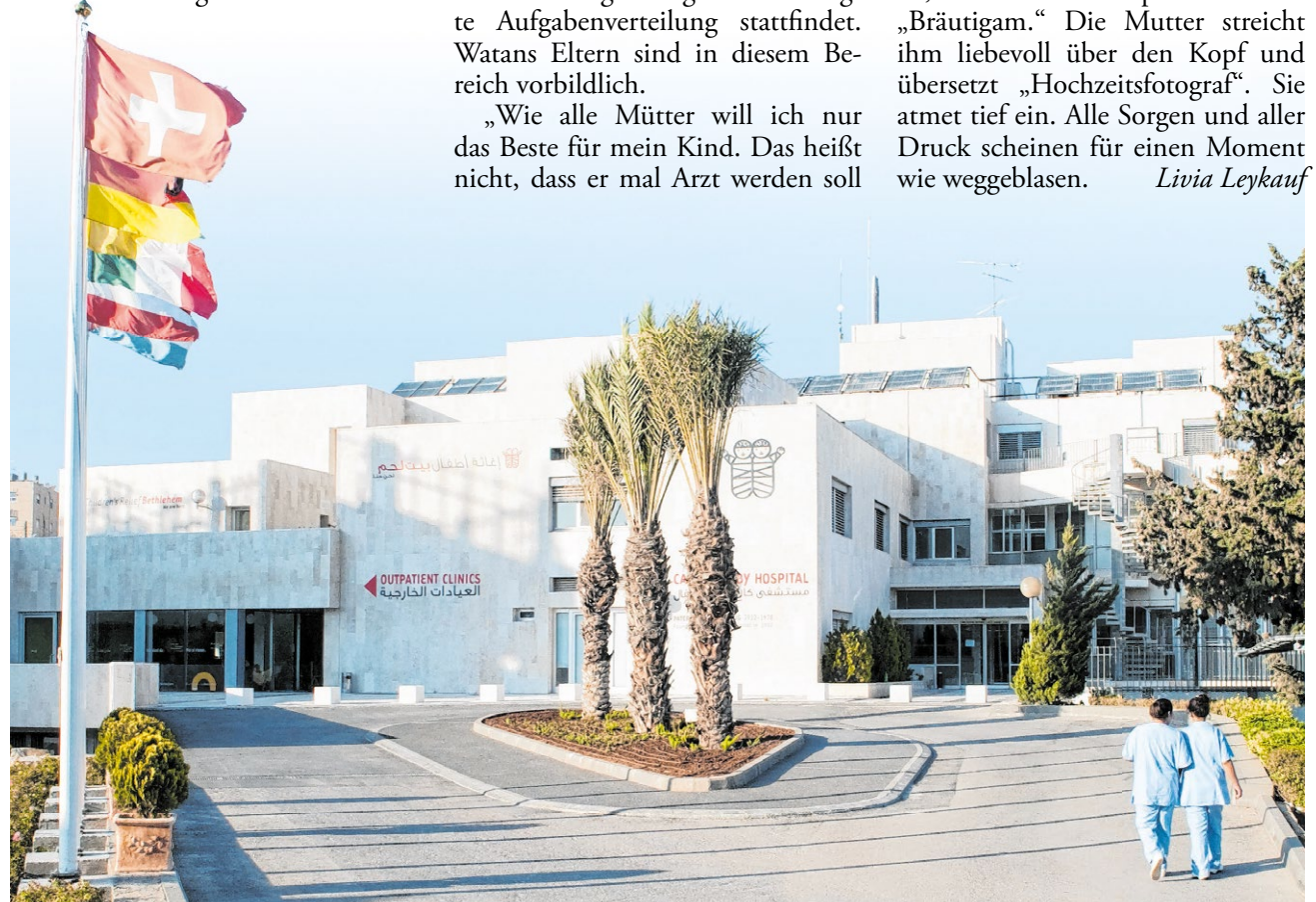
▲ Das Caritas Baby Hospital in Bethlehem behandelt im Jahr mehr als 46 000 Kinder aus dem Westjordanland. Die Klinik gilt als eine Oase der Genesung und des Friedens im Heiligen Land.