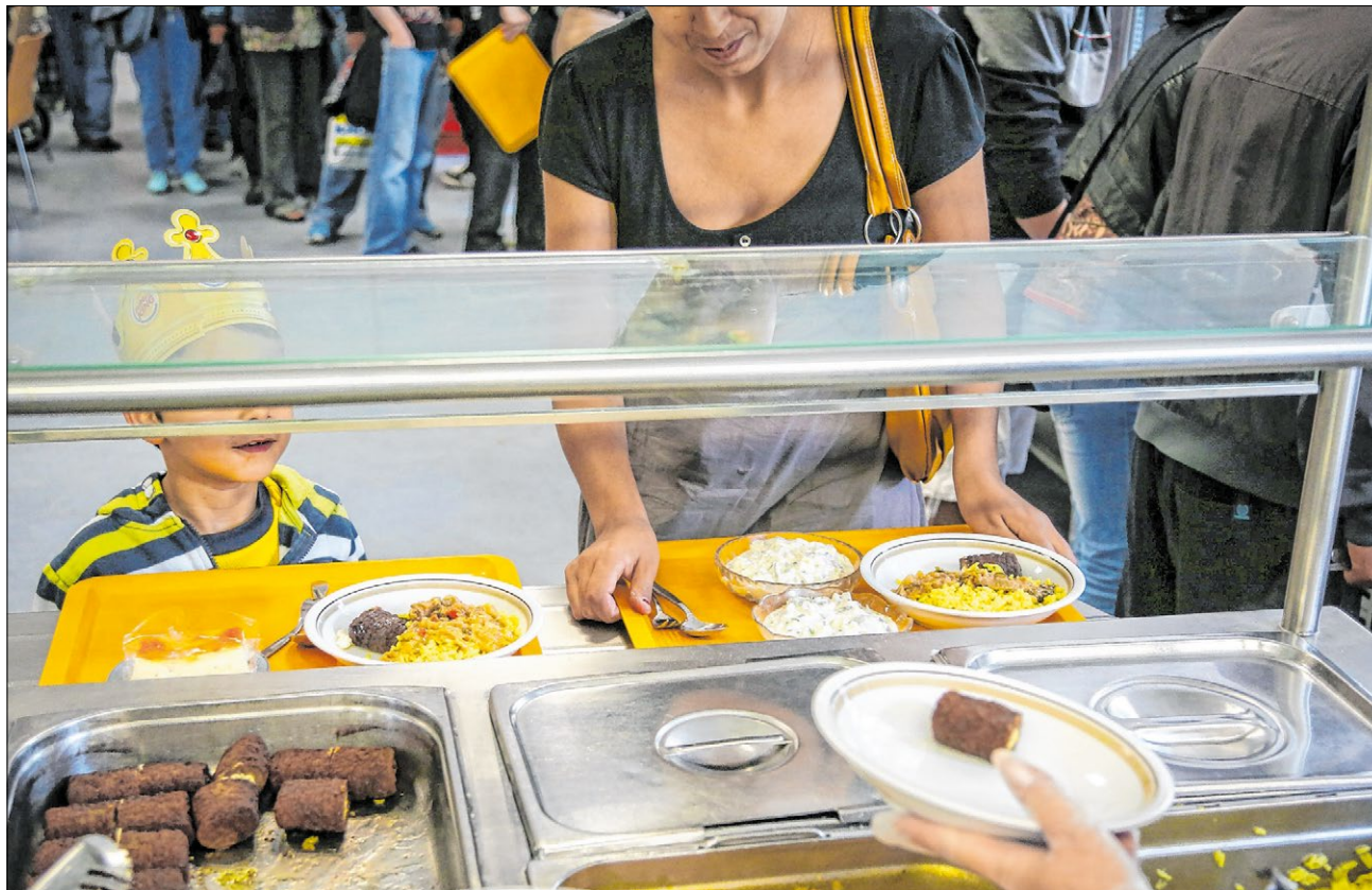
▲ Anstehen für eine warme Mahlzeit in einer Tafel. Armut gibt es auch im reichen Deutschland.

Wer in Deutschland mit Armut zu tun hat, kann schon mal eine Überraschung erleben