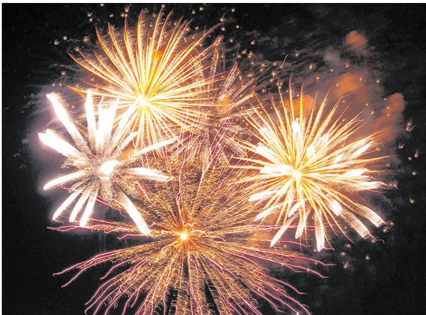
▲ Mit einem Feuerwerk wird das neue Jahr empfangen.

Was auch immer das neue Jahr bringen mag – ob Freude oder Leid, frohe oder traurige Stunden, eines ist sicher: Wir alle befinden uns in Gottes Hand, der für uns in seinem Sohn Jesus Christus Mensch geworden ist und uns auf allen Wegen begleitet. gw