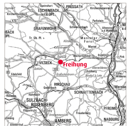
SUV-Grafik, Landesamt für Vermessung und Geoinformation

Mitte des Ortes wurde damals erneuert und mit einem Wasserspielplatz ausgestattet. S. W.