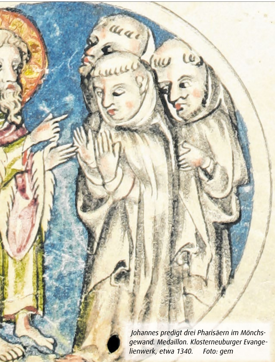
Johannes predigt drei Pharisäern im Mönchsgewand. Medaillon. Klosterneuburger Evangelienwerk, etwa 1340.