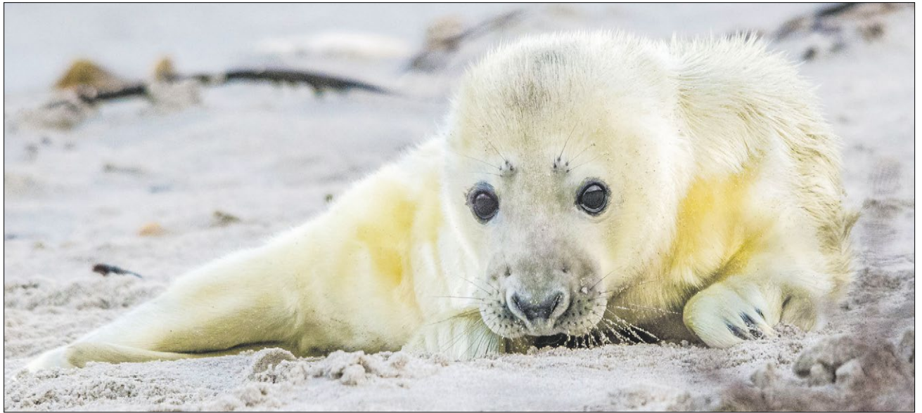
▲ So niedlich die kleinen Robbenbabys auch aussehen, sie sind keine Kuschtiere.

Diese geschützten Rückzugsorte der Kegelrobben sind besonders für