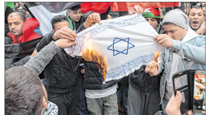
▶ Demonstranten in Berlin verbrennen eine nachgemachte Israel-Flagge.

Der Koordinationsrat der Muslime (KRM) ging in einer Stellungnahme nicht eigens auf die anti-israelischen Demonstrationen ein, rief jedoch Muslime, Christen und Juden auf, für den Dialog einzutreten. KRM-Sprecher Zekeriya Altug verurteilte die Entscheidung der USA. Sie berge die Gefahr „die instabile Situation im Nahen und Mittleren Osten noch weiter zu schwächen“.