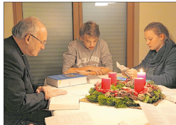
▲ Auch die Kinder der Familie Häusler aus der Regensburger Pfarrei St. Wolfgang feierten mit Bischof Rudolf Vorderholzer den Hausgottesdienst.

Im Advent und an Heiligabend ist der Hausgottesdienst dazu da, sich auf die Ankunft des Herrn vorzubereiten. Wer selbst den Hausgottesdienst daheim abhalten möchte, kann das dazu erstellte Heft im Bischöflichen Seelsorgeamt Regensburg bestellen (Tel.: 09 41/5 97-16 03; E-Mail: seelsorgeamt@bistum-regensburg.de).