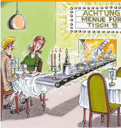
„Zugegeben, früher waren die Candle-Light-Dinner hier etwas romantischer.“ Illustration: Jakob