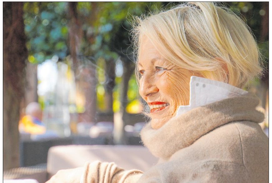
▲ Die Krebstherapie hat in den vergangenen Jahren große Fortschritte gemacht. Viele Patienten können deshalb optimistisch in die Zukunft blicken.