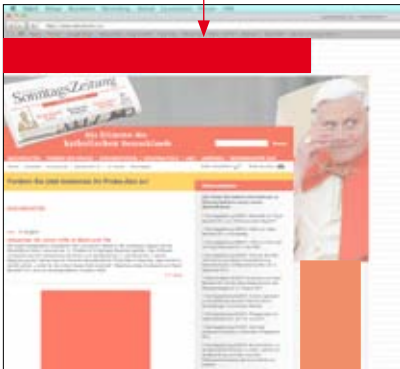
Super-Banner 728 x 90 Pixel Leaderboard