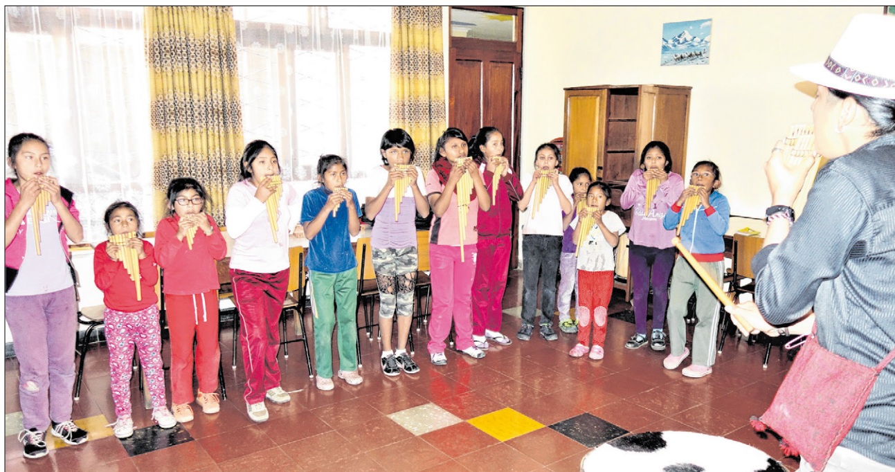
▲ Die Mädchen bei einer Flötenstunde. Seit vergangem Jahr ist ein Musikprojekt Bestandteil der Betreuung im Kinderheim der Josefsschwestern in Sucre.