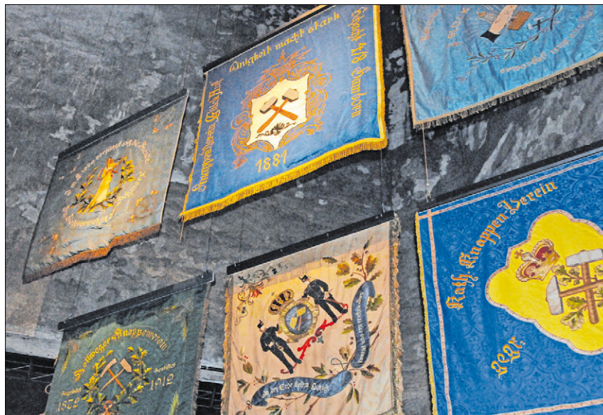
▲ 257 Knappenvereine wurden an der Ruhr ins Leben gerufen. Einige Vereinsflaggen sind derzeit in der Ausstellung zu betrachten.

Die Ausstellung in der Zeche Zollverein, Arendahls Wiese, 45141 Essen, ist täglich von 10 bis 18 Uhr geöffnet. Eintritt zehn Euro, ermäßigt sieben Euro, Kinder und Jugendliche unter 18 Jahren, Schüler und Studenten unter 25 Jahren frei. Die Ausstellung ist weitgehend barrierefrei. Weitere Informationen im Internet: www.zeitalterderkohle.de .