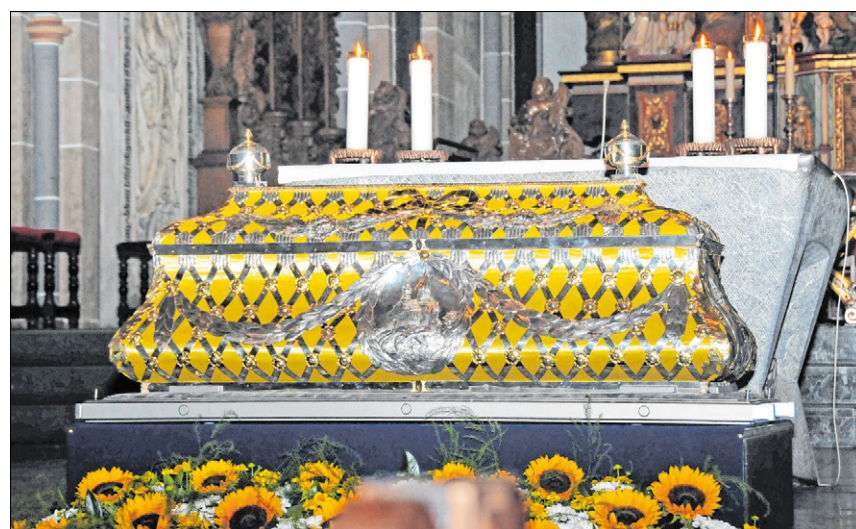
▲ Der Silberschrein wurde 1787 für die Reliquien des heiligen Liudger angefertigt.

Die Feierlichkeiten zum Ludgerusfest dauern vom 31. August bis zum 2. September. Höhepunkt ist das Pontifikalamt mit anschließender Reliquienprozession am Sonntag um 10 Uhr. Zelebranten sind unter anderem der Essener Bischof Franz-Josef Overbeck und Bischof Felix Genn aus Münster.