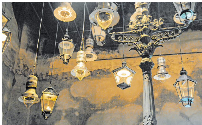
▲ Es werde Licht: Dank der Kohle konnten Anfang des 20. Jahrhunderts die Straßen nachts durch Gaslaternen erleuchtet werden.