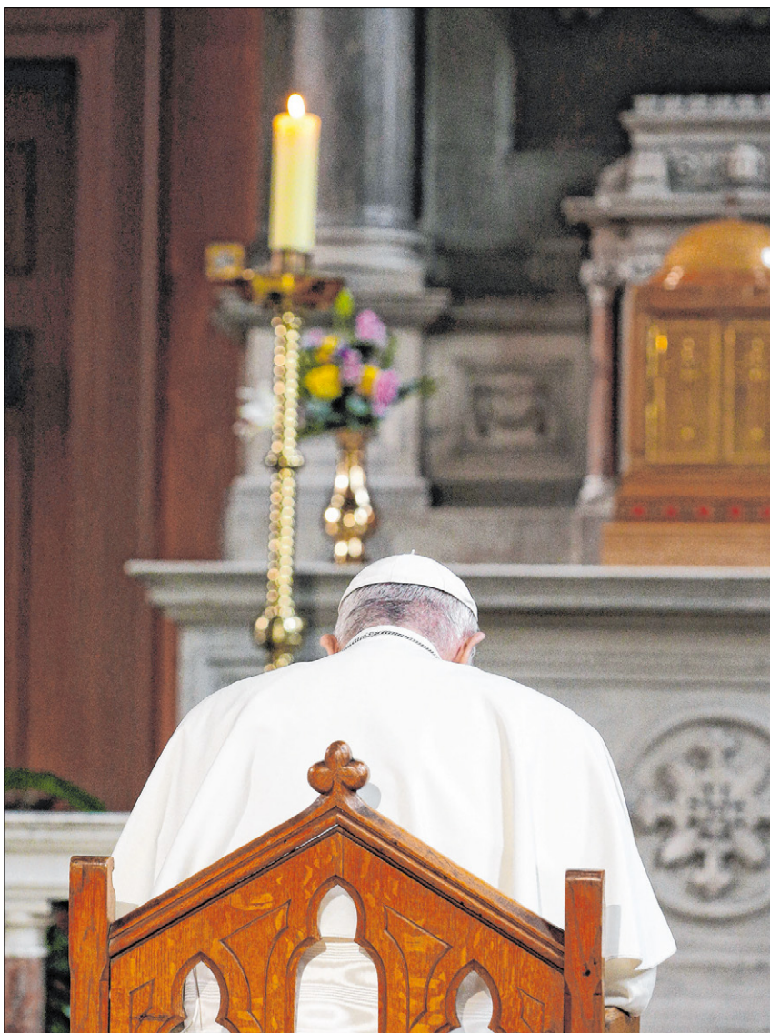
▲ In der Seitenkapelle von St. Mary's in Dublin betete Papst Franziskus still für die Opfer sexuellen Missbrauchs.

milientreffens. Mehr als 82 000 Menschen aus 116 Ländern waren dabei, darunter neben einheimischen Familien beispielsweise solche aus dem Irak, aus Burkina Faso und Kanada. Sie erläuterten in Vorstellungsvideos, wie sie ihren Glauben im Alltag erleben und wie ihnen die Freude der Frohen Botschaft weiterhilft. Darauf