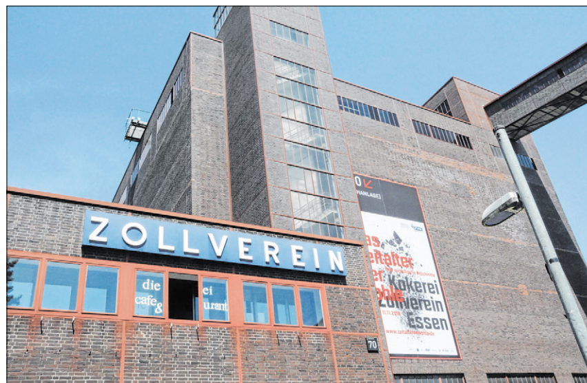
▲ Ort der Sonderschau: die Mischanlage der Kokerei Zollverein.

Wo es weder Tag noch Nacht gibt, wurde die „Schicht“ erfunden. Erst später übernahm die Industrie das Arbeitsmodell mit wechselnden Einsatzzeiten. Bis heute lebendig ist die Solidarität. Im spärlich erleucht-