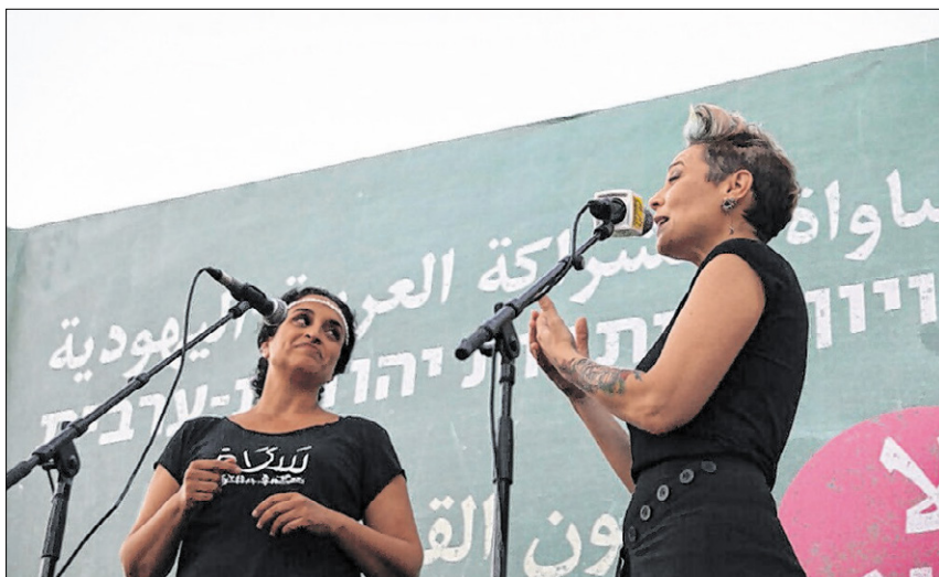
▲ Berühmte Sänger wie Mira Awad und Achinoam Nini begeisterten die Menge mit einer Mischung aus hebräischen, arabischen und englischen Liedern.

Das Gesetz sende ein eindeutiges Signal an die palästinensischen Bürger Israels, dass sie in diesem Land nicht zu Hause seien. „Es reicht nicht, individuelle Rechte zu haben und zu garantieren. Jeder Staat mit großen Minderheiten sollte die kollektiven Rechte dieser Minderheiten anerkennen und die Erhaltung ihrer kollektiven Identität einschließlich ihrer religiösen, ethnischen und sozialen Traditionen gewährleisten“, formuliert die Erklärung.