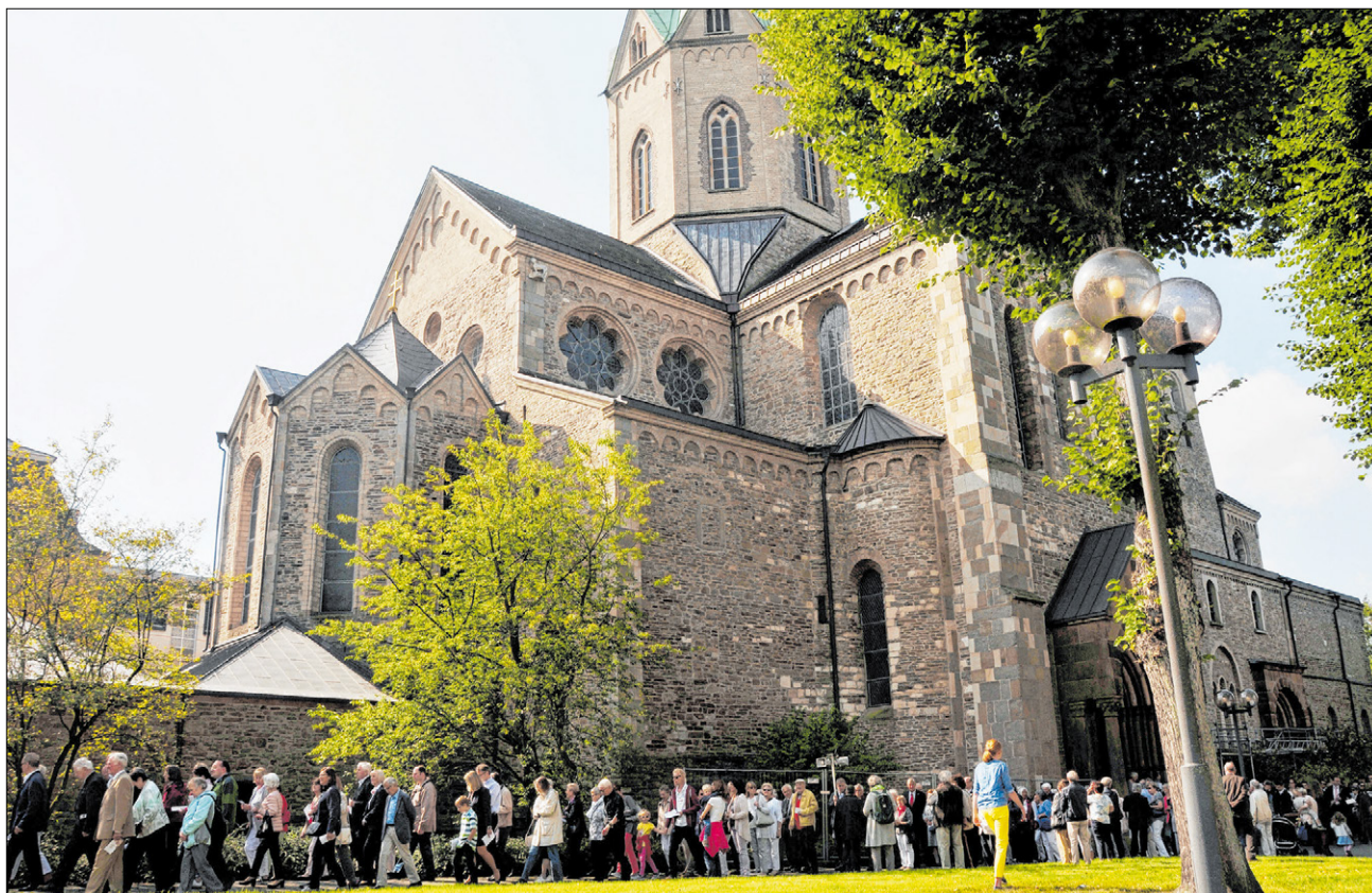
▲ Seit dem zwölften Jahrhundert tragen die Gläubigen die Reliquien des heiligen Liudger jedes Jahr in einer Prozession um die Basilika St. Ludgerus in Essen-Werden, in der die sterblichen Überreste des Heiligen aufbewahrt werden

Zum 890. Mal feiert Essen den heiligen Liudger mit einer Reliquienprozession