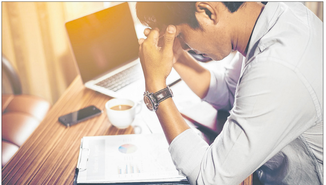
▲ Experten sind der Meinung, dass die heutige Lebensweise, in der Leistung einen hohen Stellenwert hat und Arbeitnehmer wenig Anerkennung erfahren, einen „Burnout“ begünstigt.

Bei aller Unterschiedlichkeit sind sich die meisten Experten einig: „Burnout“ hat etwas mit der Art und Weise zu tun, wie wir heute leben. Wenn ältere Menschen von früher berichten, erzählen sie oft von sehr harten Zeiten. Dennoch ist meist keine Verbitterung spürbar, sondern eher Stolz auf das, was geleistet wurde. Vermutlich gab es in ihrem Leben, was viele Experten als gute „Burnout“-Prophylaxe ansehen: Struktur, Sinn und Anerkennung.