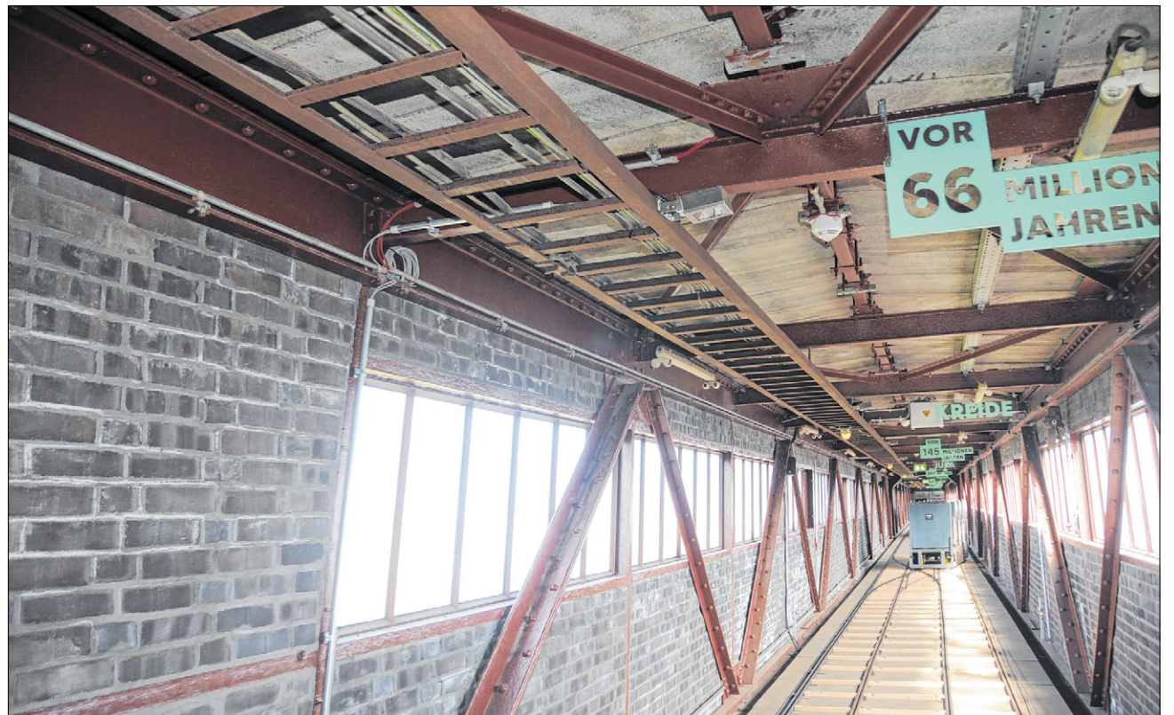
▲ Mit der Seilbahn fahren die Besucher der Sonderausstellung hoch zur Kokerei-Mischanlage – und durch die Erdgeschichte.

Ratternd geht es in den alten Transportwagen 35 Meter hoch zur Mischanlage, rund zwei Minuten über die Bandbrücke. Eine Zeitreise durch die Erdgeschichte, erläutert durch Hinweisschilder an der Decke. Nach 150 Metern kommen die Besucher im Karbon-Diorama an