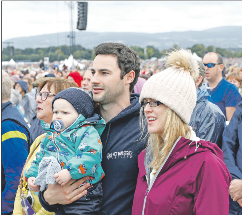
◀ Eine junge Familie verfolgt die Messe mit Papst Franziskus im Phoenix Park in Dublin.

Franziskus bezeichnete dann wenige Stunden später beim großen Familienfest in Dublin die Familie als „Vermittlerin wichtiger Werte“. Irische Gesänge, Tänze und bunte Fahnen prägten das Fest des Weltfa-