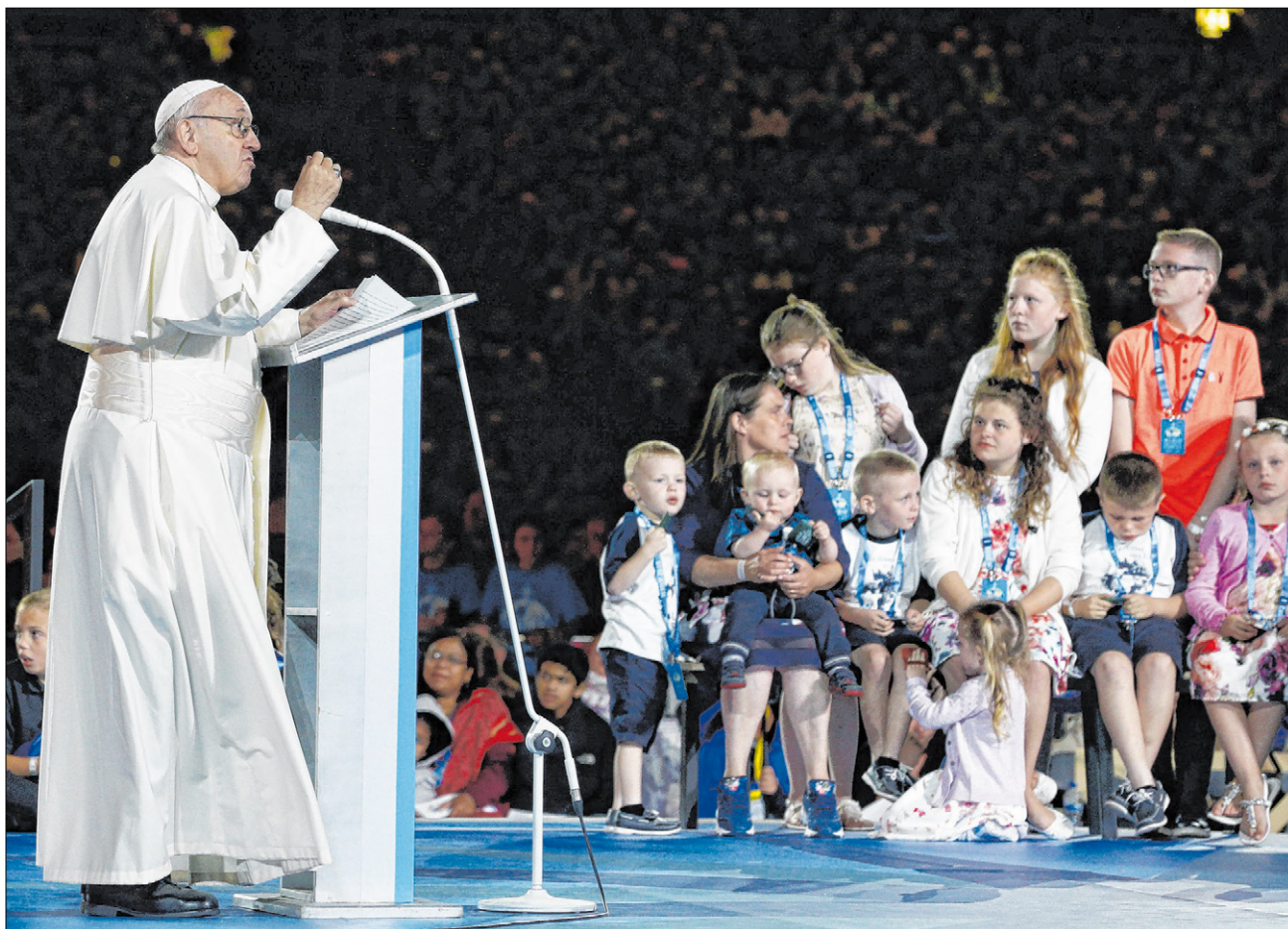
▲ Beim Fest der Familie im Croke Park Stadium ermunterte Papst Franziskus zur Weitergabe der Frohbotschaft.