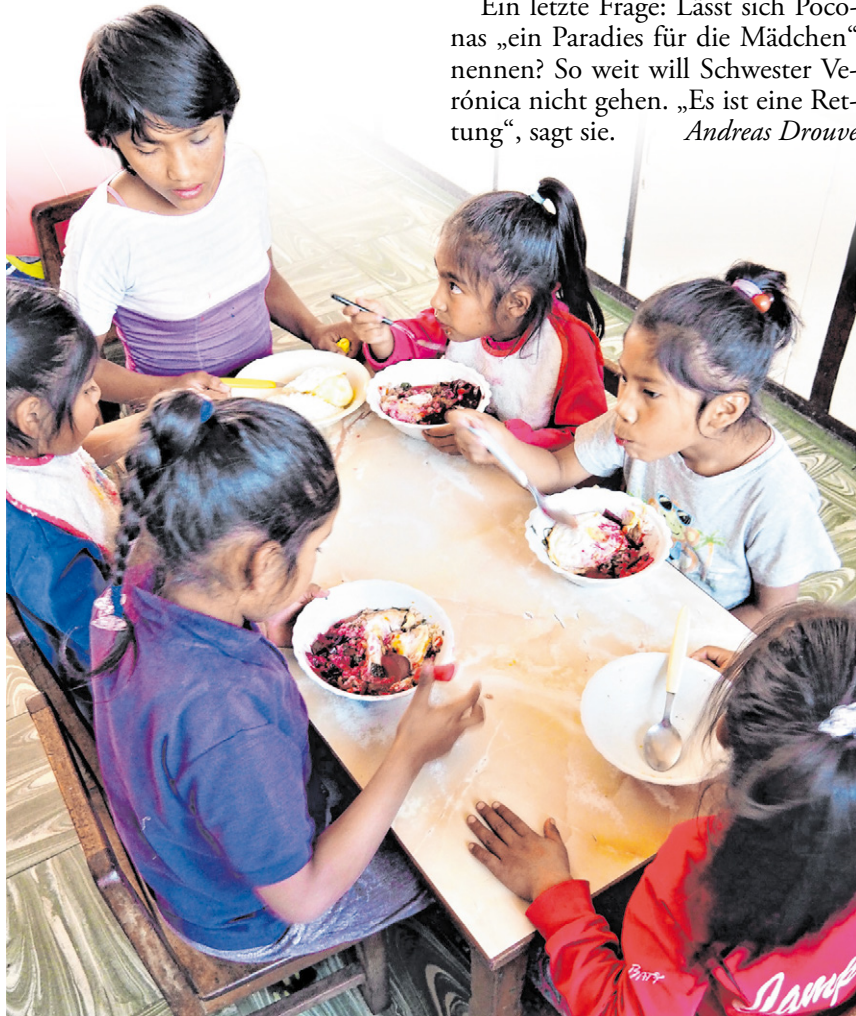
▲ Beim Mittagessen helfen die größeren Mädchen den kleineren.

Ein letzte Frage: Lässt sich Poconas „ein Paradies für die Mädchen“ nennen? So weit will Schwester Verónica nicht gehen. „Es ist eine Rettung“, sagt sie. Andreas Drouwe