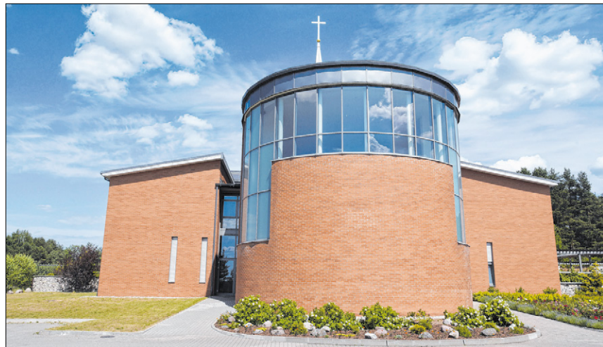
▲ Die Klosterkirche von Ikšķile wurde bereits 2011 geweiht. Nun beginnt auch das Klosterleben für die Karmelitinnen.

Die Priorin erklärt: „Unsere Berufung ist es, in der Verborgenheit zu leben.“ Sie fährt fort: „Natürlich ist es ein Wagnis, hier in Lettland ein kontemplatives Kloster zu gründen. Dazu braucht es auch ein Stück Freude am Abenteuer. Es braucht die Überzeugung, zu dieser Zeit, an diesen Ort, zu diesem Dienst für die Kirche gerufen zu sein. Und: Ja, wir sind überzeugt, dass unser Gebet Mauern überspringt.“